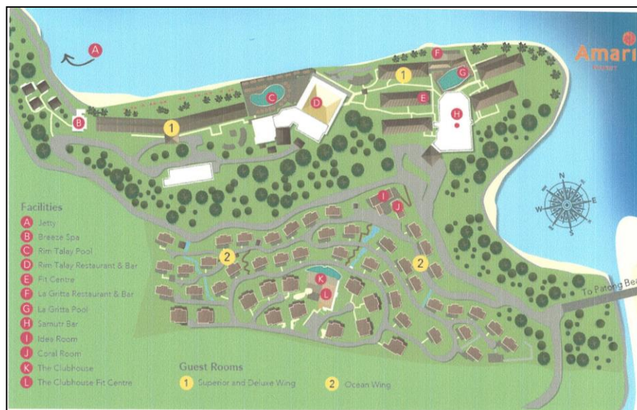
ภาพที่ 1.2 แผนที่แสดงพื้นที่การใช้ประโยชน์ต่าง ๆ ภายในโครงการ